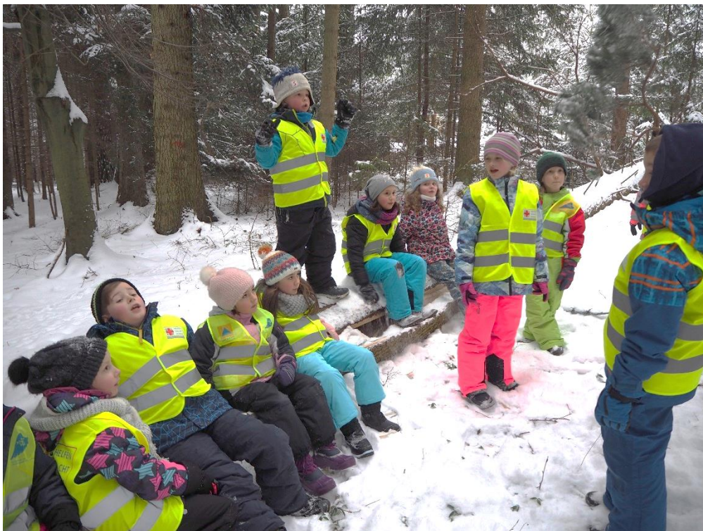
1. und 2. Klasse