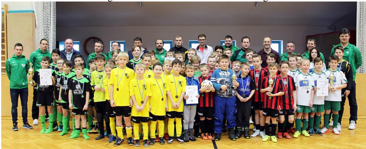
Die teilnehmenden U11 Teams samt Betreuern

Am Nachmittag setzten dann die Mannschaften der Altersgruppe U11 fort. Auch hier spielten 5 Vereine mit: USV Karlstein, LV Lichtenau, UFC Rastendorf, SV Vitis und der SV Waldhausen. Bei diesem Turnier setzte sich der Gastgeberverein aus Waldhausen durch und gewann das Turnier.