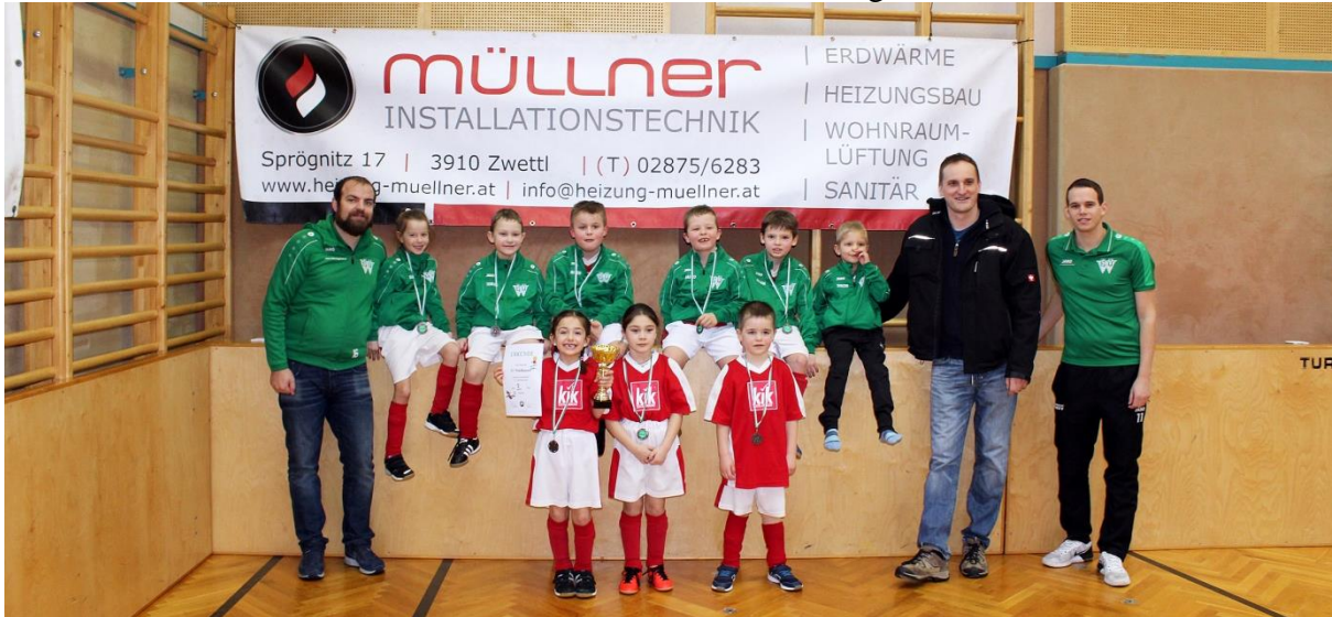
Das SV Waldhausen U7 Team nach dem spannenden und erfolgreichen Turnier.

Am 18. Februar veranstaltete der SV Waldhausen einen Nachwuchs-Turniertag in der Sporthalle Waldhausen. Am Vormittag spielten Mädchen und Burschen der Altersgruppe U7 mit Eifer vor zahlreichem Publikum. Teilnehmende Mannschaften waren SV Albrechtsberg, SCU Kottes, SV Lichtenau, SV Vitis und der SV Waldhausen. Den Turniersieg erreichte hier das Team des SV Vitis.